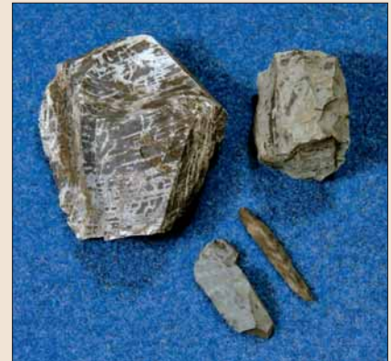
Rhyolittsteinar frå Siggjo.

På toppen av SIGGJO kan du sjå merke etter fleire tusen år gammal steinbryting. Bergarten vert kalla rhyolitt. Den varianten som finst på Siggjo, er særmerkt og lett kjenneleg, med ein mørk grønleg botn-farge og lysare årer og spetter. Steinen vart broten frå fjellet med eld og vatn. I avfalls-dyngjene med rhyolittfliser som steinalderfolket let etter seg, har vi funne trekol som er radiologisk datert.