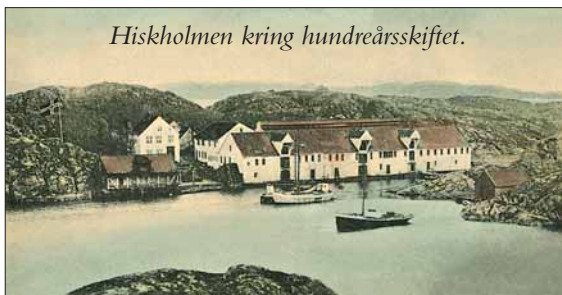
Hiskholmen kring hundreårsskiftet.

låg så sentralt i vårsildfeltet. I Baadehuset låg doktorsalen, sjefssalen og dommarsalen på rekkje, og på loftet var det losji for fiskarar som låg «floglagde» på golvet i dei store sildeperiodane. Baadehuset er i dag vakkert restaurert av det lokale husmorlaget og er oppe for vitjing etter avtale. □