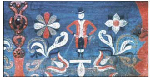
Kiste frå Mauranger, måla i 1807 av Ølvemålaren.

Spør ein om meininga med figurane, vert ein svar skuldig. Mykje talar for at helleren ein gong i tida, kanskje for 3000 år sidan, har vore ein heilagdom for gudsdyrking, tilbeding og kulthandlingar. Dei merkelege figurane må ha hatt sin plass i ein kult der sol og grøderikdom har vore sentrale element. □