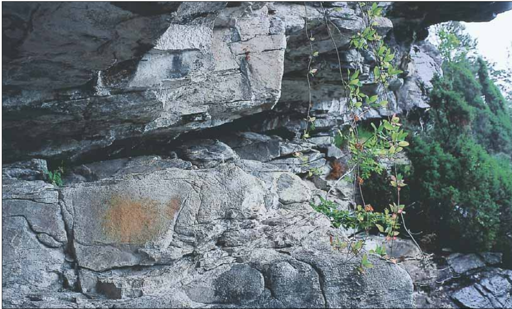
Bergmåling under Geithidleren – eit kostesamt klenodium.

Under eit sørvendt, bratt berg på ÅRSAND, finst eitt av dei merkelegaste forminna i heile Hordaland. Den utoverhengande bergveggen formar ein grunn heller – GEITHIDLEREN. Delar av hellerveggen er dekt av ei lys kalkskorpe, og på kalken er det måla figurar med gylne og rustraude fargar.