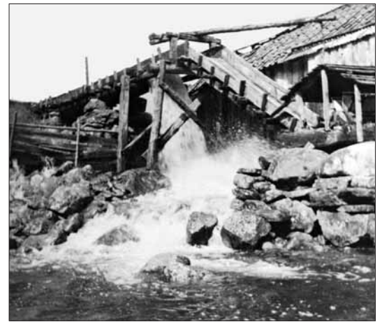
Sag på Mollandseid kring 1950.

Sagbruket og kverna var i bruk til etter den andre verdskrigen. □