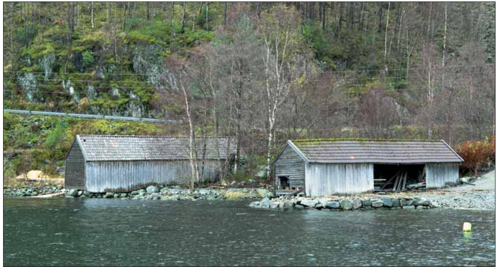
Sagene på Mollandseid.

I MOLLANDSVÅGEN, like ved elva som renn frå Mollandsvatnet og ut i fjorden, ligg to vassdrivne sirkelsager og ei kvern. Dette sag- og kvernbruket har høyrte til gardane Molland, Reknes og Duesund, som saman eig rettane til vassfallet.