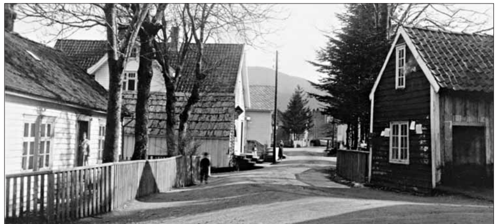
«Sjoargarden» ovanfor dampskipskaia i Ølensjøen kring 1935. På «vaskehuset» (til høgre) var det veggavis. Her møttest folket kvar kveld for å venta på «dampen».

Det låge eidet mellom Ølen og Sandeid gjev ei god forklaring på at Ølen sidan forhistorisk tid har lege midt i hovudsambandet mellom Rygjafylket og Hordafylket. Her er det ein kort og lett veg frå fjord til fjord, og i mellomalderen var det denne vegen biskopen i Stavanger drog når han skulle på visitas til Hallingdal, som høyrde til Stavanger bispedømme fram til 1631. På 1800-talet vart sambandet frå vest mot aust bygt ut. □