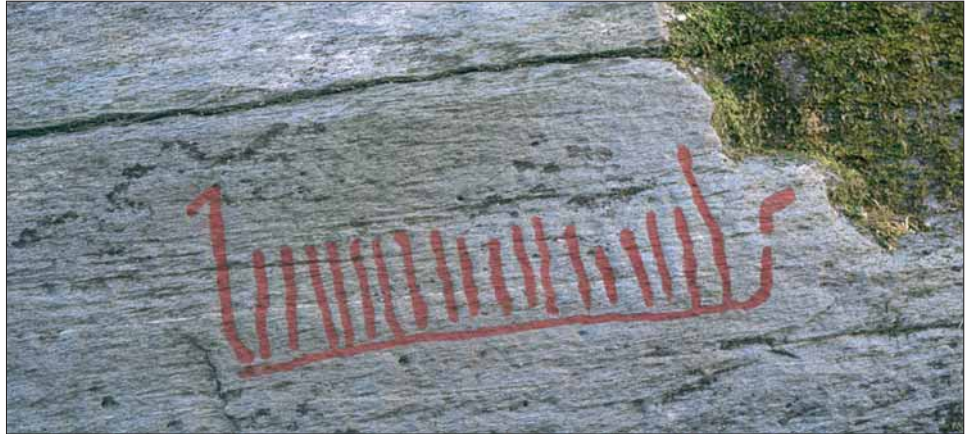
Skipsfigur frå bronsealderen ved ferjekaien på Utbjoa.

I utmarka i Eikås står enno Arquebushytta, som vart bruka som hemmeleg møtestad. Radiosendararen kan vi i dag sjå på «Arquebus krigshistoriske museum» i Førdesfjord (Rogaland). Bilete frå 1990.