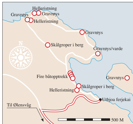
Kart over fornminnemiljøet på Utbjoa.

Innanfor eit lite område nordvest for ferjekaien på Utbjoa finst fire helleristningsfelt, to felt med skålroper, fire båtopptrekk og fem gravrøysar. □