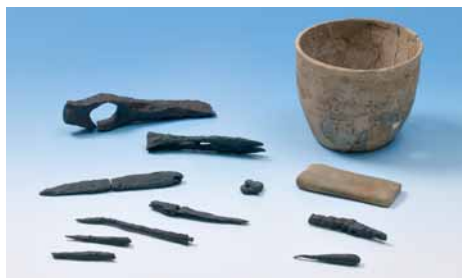
Gravfunn frå Eide.

Dei fleste av dei 13 haugane som framleis finst, er runde, men her er også nokre avlange. Ein langhaug har skipsform, med rett avskorne stammar, markert med kantsteinar. I kvart hjørne står ein reist stein. Somme av rundhaugane er høge og dominerande, andre er lågare og lite synlege. Dei to største er 18 og 17 meter i tverrmål, den eine er flat og vid med kantkjede av stein, den andre er nære på 2 meter høg.