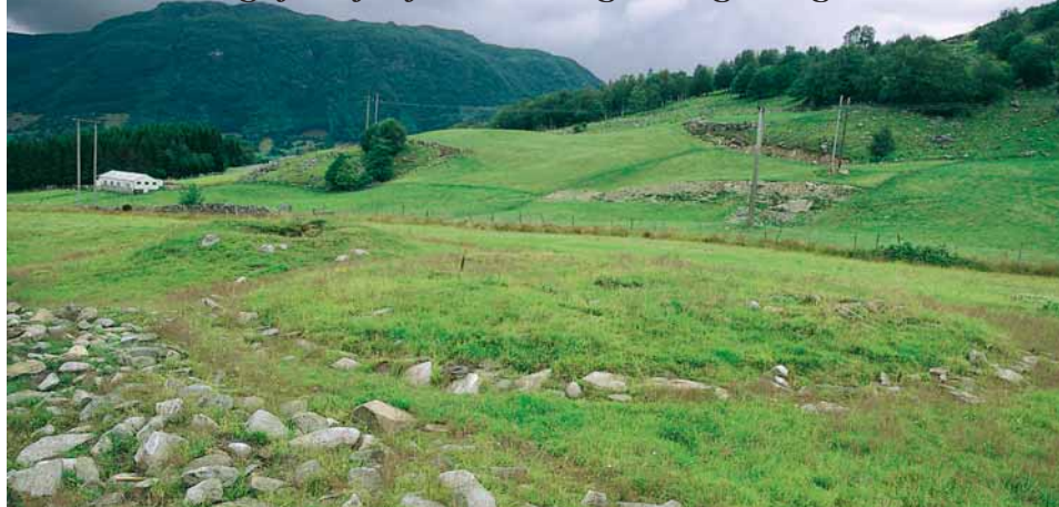
Gravroys med kantkjede av stein.

På VESTRE EIDE, på toppen av terrassen like aust for vegen til Sandeid, ligg det største gravfeltet frå heiden tid i Ølen. Her bar vore minst 27 haugar, no er det berre 13 att. Frå dette gravfeltet er det gjort mange funn frå folkevandringstida og vikingtida.