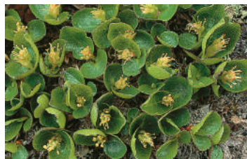
Hannplante av musøyre. (Jan Rabben)

Frå dei bratte, høge fjellsidene går det snøskred, som legg att store snøfenner i delar av dalsida. Her er det ein flora av artar som krev mykje lys, til dømes fjellsmelle, engkall og torskemunn. I rasmark veks bregnen hestespeng i store mengder. Nokre stader i Ænesdalen inneheld rasmarka mykje steinblokker etter at litt av den bratte fjellsida har losna og har rasa gjennom skogen. Blokkene kan ha ein imponerende storleik, svære som hus.