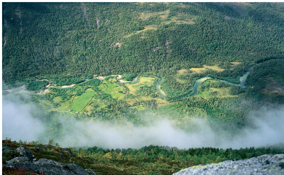
Æneselva buktar seg, meandrerer, ned gjennom Ænesdalen. Ænesseter framfor beitemarka til venstre på bildet. (Svein Nord)

Innafor Vatnastølsvatnet er det lite skog, sjølv om områda her ligg under 500 moh. Beiting kan vera ei forklaring på dette, eller det kan tenkjast at mykje snø utover våren gir for korte somrar til at bjørka kan veksa opp. Inst i Ænesdalen er det lite vegetasjon, fordi berre nokre få planter toler dei store snømengdene. Musøyre er ei slik plante som trivst godt, mellom anna fordi ho slepp å kjempa med andre planter om plassen. Her finst det òg einskilde andre snøleieplanter, slik som brearve og stjernesildre. Dei har tilpassa seg forholda nær evig snø og is. På stader der bakken ikkje smeltar fram kvar sommar, er det berre mosen som klarar seg.