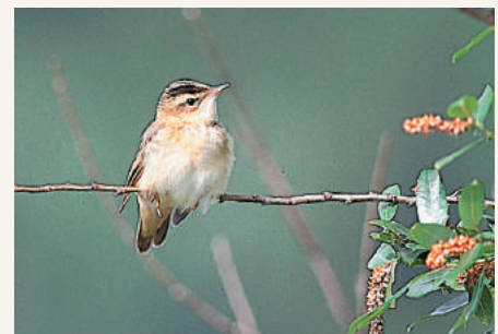
Sivsongar; sjeldan å sjå, men lett å bøyra – ein typisk fugl i dei rike våtmarkene i Sveio.

Å sjå til er kanskje Lokna perla mellom dei verna våtmarkene, medan Bjellandsvatnet og Mannavatnet har det rikaste fuglelivet. Det er ikkje ferdslerestriksjonar i nokon av desse våtmarksreservata, men ein pliktar å ta omsyn til dyre- og plantelivet når ein går i naturvernområde.