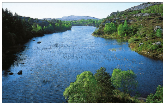
Frå Midtvatnet, eit av vatna i Fjellvassdraget. (Svein Nord)

Vassdraga tener òg andre funksjonar: Dei siste tiåra er nokre av områda, som frå gammalt av var oppdemde for kvern og sag, overtekne av vasskrevjande oppdrettsanlegg for smoltproduksjon. Andre vatn er demde opp for å tena som