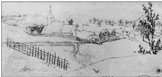
Kyrkja på Kyrkjebyrkjeland vart riven i 1878.