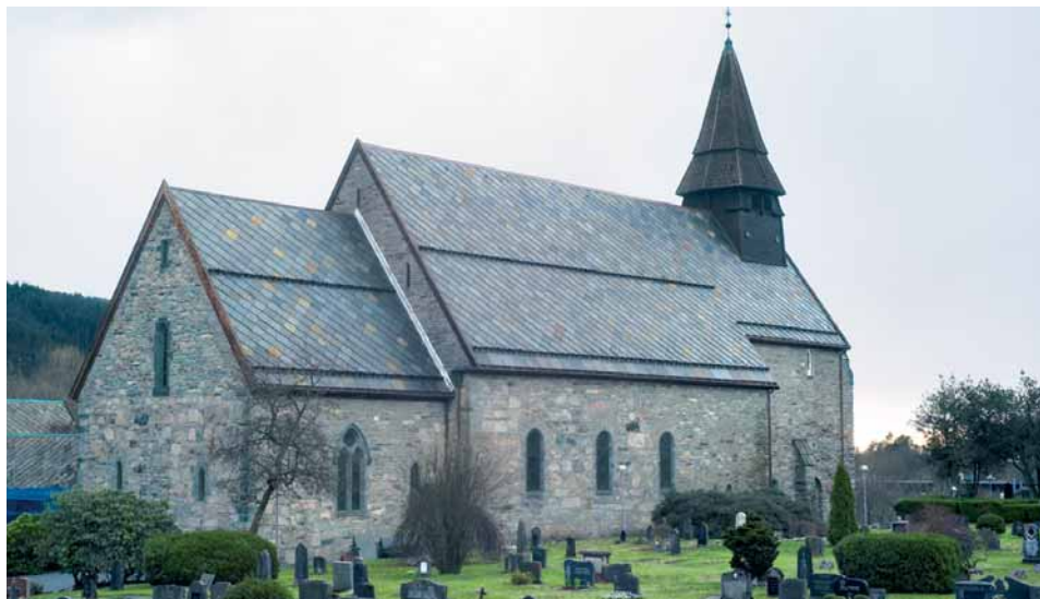
Fanakyrkja slik ho vart restaurert av Frederik Konow Lund i 1926–27.

I området kring Fana kyrkje har det lege fleire store gravhaugar frå førkristen tid. I dag ligg berre ein av desse att; på vollen ved vegen til skogforskningsstasjonen. Opphavleg var haugen rund med ein diameter på 18 meter, i dag er han avlang og mindre. I eldre tid låg det her to haugar til. På den eine stod det to 4 meter høge bautasteinar som vart fjerna i 1762. Bøndene kalla dei «kjempesverd», og etter tradisjonen markerte dei den eldgamle halvfylkesgrensa mellom Nordhordland og Sunnhordland.