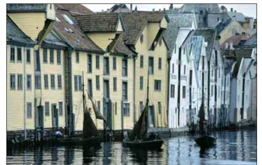
Skuteviksbodene omkring 1990. T.v.: Frå Rosesmuggrenden.