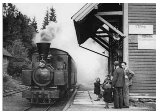
Stend stasjon i 1935.

STEND STASJON er den einaste av dei tidlegare stasjonsbygningane på Nesttun-Osbanen som enno står i si opphavlege form. Etter at banen var nedlagd i 1935, vart bygningen overteken av Hordaland fylke og brukt til lærarbustad for Stend Jordbrukskule og ulike andre formål. Foreningen Osbanens Venner har arbeidd for å få freda Stend stasjon. På stasjonsområdet er det sett opp ei restaurert Osbanevogn. Osbanens Venner har også ei stor samling gamle foto og filmstubbbar, reklameskilt og gjenstandar frå Osbanen.