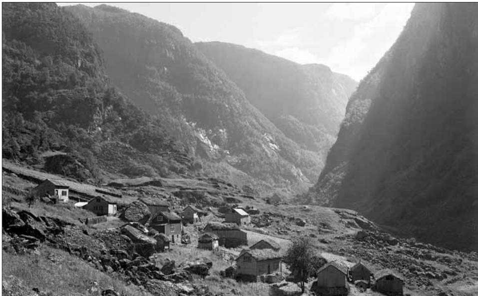
Klyngjetunet i Hjølmodalen tidleg i dette hundreåret.

I den bratte dalsida i HJØLMODALEN, ein liten sidedal frå Øvre Eidfjord som har vore ein sentral oppgang til Hardangervidda, ligg framleis det gamle fellestunet samla. Tunet står tomt idag; nokre av busa er i bruk sommarstid, men graset veks kring alle nover.