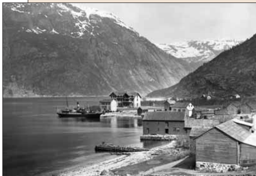
Heggjagarden (i forgrunnen) og Vøringsfoss Hotel først på 1900-talet.

Skysskiftet på garden Vik i Eidfjord var ein viktig del av kommunikasjonssystemet i eldre tid. Her fekk dei rorskyss ut fjorden, dei som kom over fjellet frå aust og ned Måbødalen. Skysskiftet låg på «Wiige grund». I dag skjer riksvegen seg gjennom tunet; hovudbygningen frå 1800-talet ligg på oppsida av vegen; det store sjøhuset, med tidlegare bakeri, ligg ned mot fjorden.