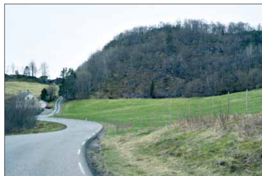
I dette området ligg restane etter bygdeborga på Vad.

I somme bygdeborgar er det funne spor etter hustuffer og brunnar eller vassgroper, der regnvatn kunne samlast opp. I slike borgar kan folk ha halde til i vekevis under ufredstider. (33).