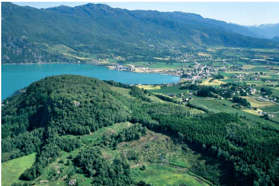
Bygdeborga på Borgåsen med Etnefjorden og Etnesjøen i bakgrunnen. Bilete frå 1990.

I Etne finst det beile fire bygdeborgar. Dei ligg alle strategisk til, slik at dei har tent som tilfluktsstader og vern for sentrale delar av bygda.