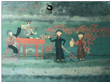
Rosemålarer si sjarmerande folkelivsskildring av skomakaren ved sin lest. Kyrping i dag.

Dei tyske styresmaktene pressa på for å få vegen ferdig, både av sysselsettings- og millitære grunnar. Vegbygginga vart såleis forsert og fekk ikkje heilt den standard som opphavleg var planlagt. Men langs vegen finst likevel mange døme på godt gamalt handtverk i steinbruer og vegmurar.