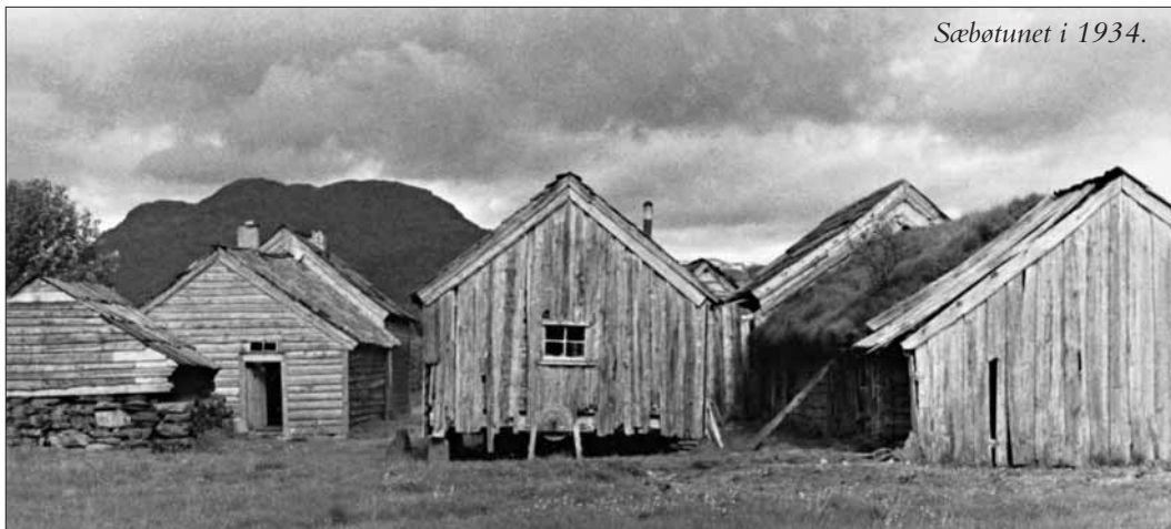
Sæbøtunet i 1934.

Når du kjem inn i det velstelte tunet på SÆBØ, like ovanfor Etne sentrum, opplever du inntrykket av ein sunnhordlandsgard lenge før traktoren si tid; frå besten og ljåen sin tidsalder. Tunet på Sæbø, ein av granne-gardane til Gjerde, vart overteke av Sunnhordland Museum i 1938.