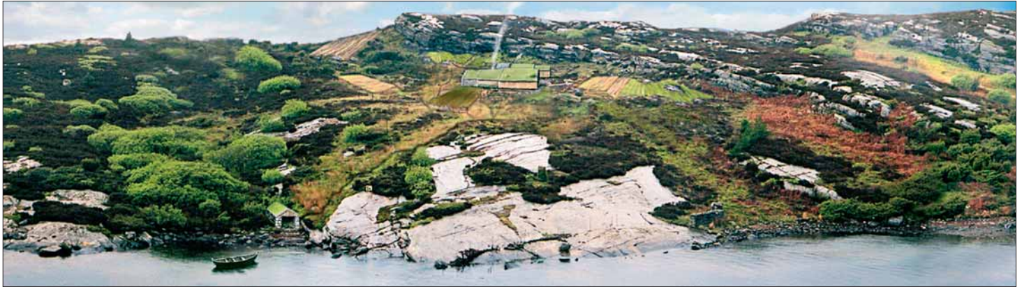
Rekonstruksjonsskisse av tunet på Høybøen.

Under utgravingar kring 1980 i regi av Historisk Museum i Bergen – i samband med dei planlagde utbyggingane for oljeindustrien på Vindenes – kom det for dagen uvanleg interessante spor etter eit gardsanlegg på HØYBØEN, med tufter etter to fleirromshus i tunet.