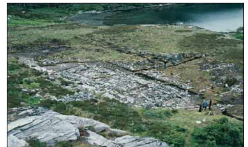
Utgraving av langhustufta.

Langhus og «litlastova» frå seinare hundreår i tunet på Ytre Fosse, Alversund; eit anlegg som liknar Høybøen