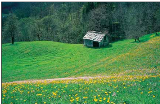
Grindløe i Steinsdalen.

Th.: Vi ser mot Furekamben på Ljoneshalvøya, med konturane av Belsnes og Tørsnes i bakgrunnen. Her er fjorden på det smalaste, og her går den gamle landskapsgrensa frå vikingtida mellom Hardanger og Sunnhordland.