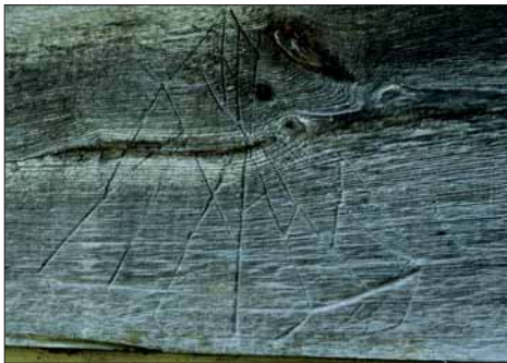
Båtfigur på eldhusveggen – eit omtykt motiv.

Garden NES like innanfor Mundheim ligg på eit skogleidd nes ut i fjorden mellom Mundheimsvika og Bonde-sundet; ein gard med eit innbydande og velstelt kulturlandskap. Men det gamle fellestunet på Nes finn vi ikkje lenger slik det låg. Røykstova og bualoftet frå «Oppistovo» og stabburet og eldhuset frå «Nistovo» vart flytt etter utskiftinga i 1912 til det nye friluftsmuseet som var under oppbygging ved NORSK FOLKEMUSEUM på Bygdøy. Øvre Nes vart delt i to bruk i 1688, og dei låg i eit felles tun fram til 1912.