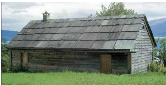
Røykstova i Vika.

Bygningane frå Nes er kjernen i vestlandstunet på Bygdøy og gjev vitjaren ein umiskjenneleg dām av Vestlandet, med røykstover og krittkvit kroting på sotsvart tømmer. Jamvel om vår tid ikkje lenger har så stor sans for museal «kulturimperialisme» som flyttar hus ut or sitt opphavlege kulturlandskap, må vi vedgå at mange dyrebare delar av den norske kulturarven på denne måten har vorte redda for ettertida. Vi kjenner det gamle fellestunet på Nes gjennom