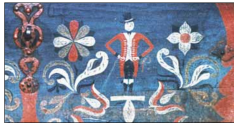
Kiste frå Mauranger, måla i 1807 av Ølvemålaren.

Spør ein om meininga med figurane, vert ein svar skuldig. Mykje talar for at helleren ein gong i tida, kanskje for 3000 år sidan, har vore ein heilagdom for gudsdyrking, tilbeding og kulthandlingar. Dei merkelege figurane må ha hatt sin plass i ein kult der sol og grøderikdom har vore sentrale element. □