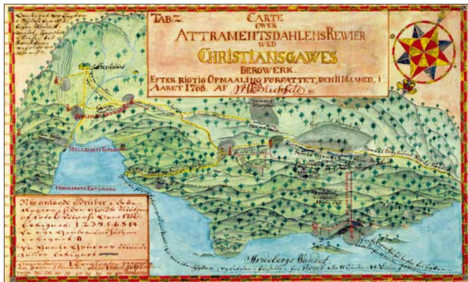
Kart over gruveområdet i Atramadalen i Ølve, teikna av bergråd H.F. Blichfeldt i 1768.

verta borte. Her som andre stader er det fare for at det gamle kulturlandskapet vil forsvinna, kanskje for alltid. Dette er ressursar som ikkje kan fornyast og som i vår tid inneber rike opplevingsverdier. Det kviler eit stort ansvar på vår generasjon for å forvalta desse verdiane. □