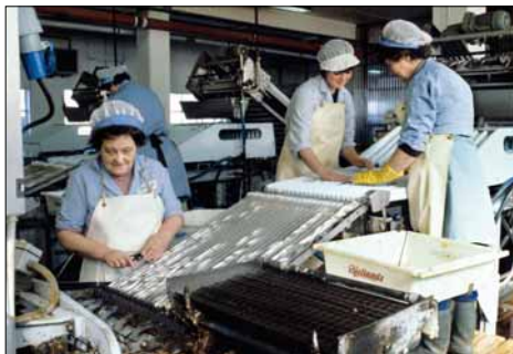
Hermetikkindustrien var ein viktig kvinnearbeidsplass.