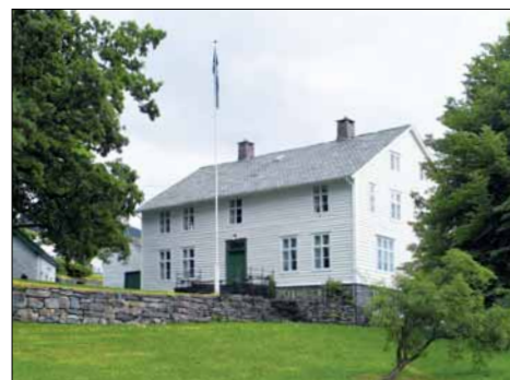
Hovudbygningen på Undarheim.