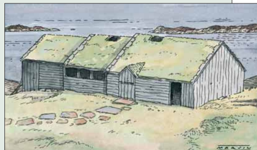
Slik kan langhuset ha sett ut.

Garden i Lurekalven har vore i drift mellom 700 og 1350 e.Kr. Granskingane syner spor både etter hus og åkrar. Tuftene som vart utgravne i 1970-åra, viser eit langhus med eldhus, stove, bu og lœ med flor. Kring tunet ligg spora etter rydningsrøyser og åkrar i solvende skråningar.