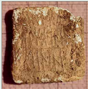
Blystykke med runer funne i ei tuft på Lurekalven.

Avfolkinga etter Svartedauden ramma særleg dei gardane som låg i utkanten av den sentrale busetnaden i bygda. Når garden vart lagd øyde, vart også gardsnamnet oftast borte; erstatta av det ubestemmelege Øygarden eller Øyjorda.