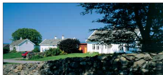
Bøgarden på Ytre Lygra.

alderfangstmannen sitt område; seinare kom bonden. Talrike spor etter menneskeleg verksemd fortel om bondesamfunnet: gravhaugar, kolmiler, åkerreiner og fornfunn – denne garden har flest fornfunn i heile Nordhordland. Funna viser at Lygra har vore ein sentral gard med vide kontaktar mot omverda heilt sidan 400-talet. Garden ligg på grøderike lausavsetningar som har gjeve grunnlag for at området utvikla seg til ein av dei beste jordbruksgardane i Nordhordland. Lygra høyrde til jordegodset