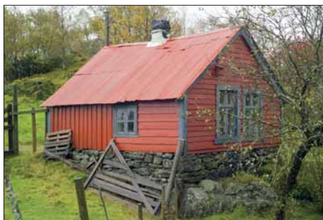
Smia på Ådland.