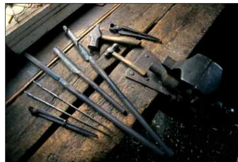
Godt verktoy er halve arbeidet.