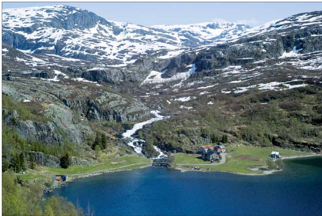
Fjellgarden Øyna i Reinsnos.

Fjellgrenda Reinsnos ligg nærare 700 mob. inst ved Reinsnosvatnet; ein innfallsport til Hardangervidda.