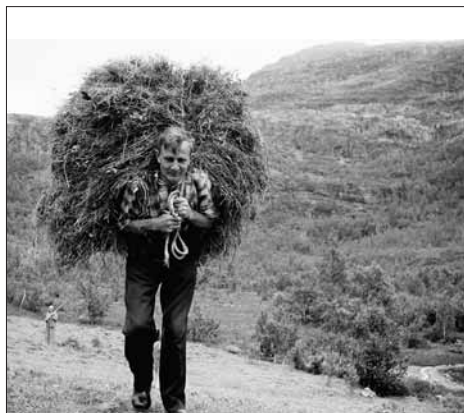
Slått ved Ljosavatnet kring 1960.

Ein annan ferdsleveg, som truleg går attende til mellomalderen, går frå Odda og vidare innover på vestsida av Sandvinvatnet. Eit spor etter mellomalderens tjodveg , ålmannavegen, frå Hardanger til Røldal, finn vi i Tjodaminnet , eit trangt pass ved Seljestadstølane. □