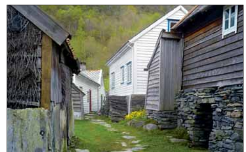
Tingata gjennom Havråtunet.

Det vestnorske klyngjetunet, med mange brukarar i same tun, er ei busetnadsform som har sett sitt preg på kulturlandskapet heilt fram til andre halvdel av 1800-talet. Då byrja dei store jordreformene som førte til utskifting av jorda og ei oppløysing av teigblandinga og det gamle tunet. Framveksten av dei store fellestuna har samanheng med folkeauken etter mellomalderen. Gardane vart delte for å gje plass til fleire brukarar.