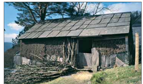
Brakeløe på Havrå.

jorda var prinsippet ved alle seinare bruksdelingar. Dette ligg bak det mønsteret som etter kvart voks fram, med 8–12 innmarksteigar på kvart bruk. Alt på 1600-talet var Havrå delt i åtte jamstore bruk. På midten av 1800-talet var det 9 bruk på garden, men i 1907 vart det eine bruket delt på fem av dei andre. I år 1900 budde det 60 menneske i tunet. □