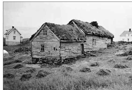
Langhuset slik det stod på Oni. Idag står det på Hordamuseet (®422).