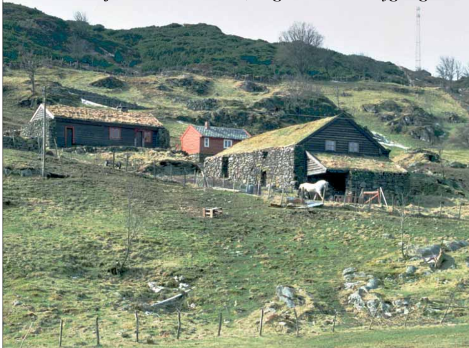
Steinbygd lóa og stovehus på Øvre Tveiten. Bilete frå 1990

I ei austhelling ovanfor Hallandsvatnet ligg tunet på ØVRE TVEITEN, to kilometer nord for Manger. Den steinbygde lóa ligg med gavlen ut i det skrånande terrenget, og det gamle våningshuset, eit lite langhus, har solide steinmurar på tre sider. Men innanfor murane er både lóa og stovehuset trebygningar.