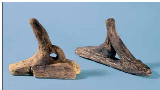
To av keipene som vart funne i myra.

Keipar og restar av åredelar fortel oss at det vart laga robåtar her. Spant- og taurestar viser at spanta vart surra til båtorda med lindebast. Spanta har eit trekanta tverrsnitt med spissen mot båtorda. Surringa gjekk gjennom hol i spantet og hol i utsparte klampar i båtorda. Ein rest av ein slik klamp er funnen. Den lette konstruksjonen gjorde båten mjuk og smidig, men samstundes svak. Det må ha vore framifrå lette robåtar. Det er til no ikkje funne restar etter båtorda, og vi veit heller ikkje korleis desse var festa. Ulik storleik på spanta viser at det er bygt båtar av forskjellig storleik, små på 3–4 m og større på 10–15 m. Det er ikkje funne gjenstandar som tyder på kjennskap til segl og rigg. Dette var båtar til dagleg bruk, og dei vart rodde, i motsetnad til dei båtane vi ser på bergbileta (①92).