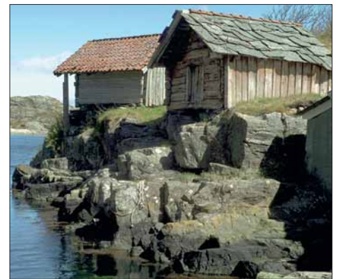
Gamle sjøbuer på Golta.

I mannsaldrar var landnota viktigaste reiskapen i fisket etter sild og makrell, og då var ein god kastevåg gull verd. Goltasundet på Golta var ein slik våg. Der seig silda ofte inn, og det kunne gjerast eventyrlege kast. Når silda eller makrellstimate kom inn Goltasundet, var det berre om å gjera å stengja vågen med nota så snøgt råd var. Alle oppsitjarane samarbeidde om notfisket. For å koma ut med nota før silda for ut att, måtte det haldast vakt. Oppsitjarane byttest om å sitja i rorbuene i Goltasundet og vakta på silda eller makrellen. Etter at snurpenota kom i bruk tidleg på 1900-talet, overtok ho meir og meir for landnota. Fiskarane var ikkje lenger avhengige av gode kastevågar. Likevel vart det gjort gode landnotkast i Goltasundet like til etter andre verdskrigen. Golten landnotlag vart truleg organisert i slutten av 1800-talet. Alle oppsitjarane, 11 i talet hadde sin part i laget, som åtte båtar, notbruk, nohengje, notbu, naust og losjibu. Triass i at siste kastet i Goltasundet vart gjort tidleg i 1950-åra, eksisterer Golten landnotlag den dag i dag; eitt av dei mest komplette landnotanlegga i Hordaland.