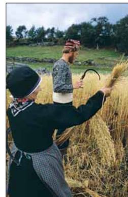
Rekonstruksjon av kornskurd med sigd, kring 1900. Kausland