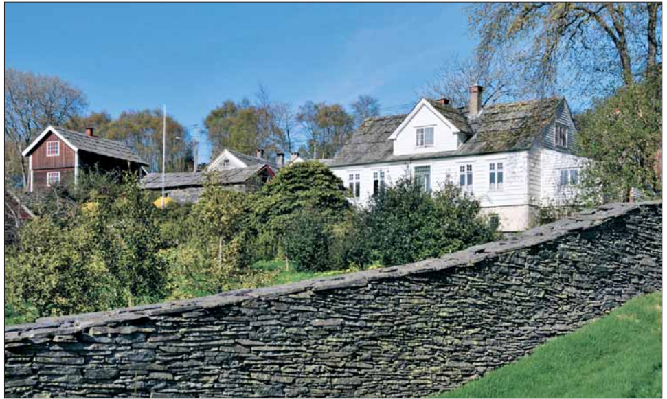
Hovudbygningen på Einstapevoll. Den einaste trebygningen på garden.

EINSTAPEVOLL (av einstape: «bregne») ligg på vestsida av Tittelsneshalvøya. Fram til 1831 var garden prestebustadgods under Stord presteembete. Prestane hadde bygselretten. Landskylda og andre avgifter frå garden var ein del av løna deira.