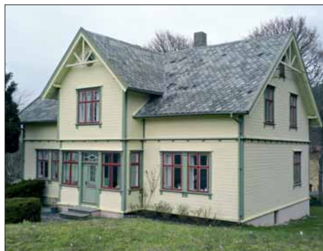
Fartein Valens hus, Valevåg.