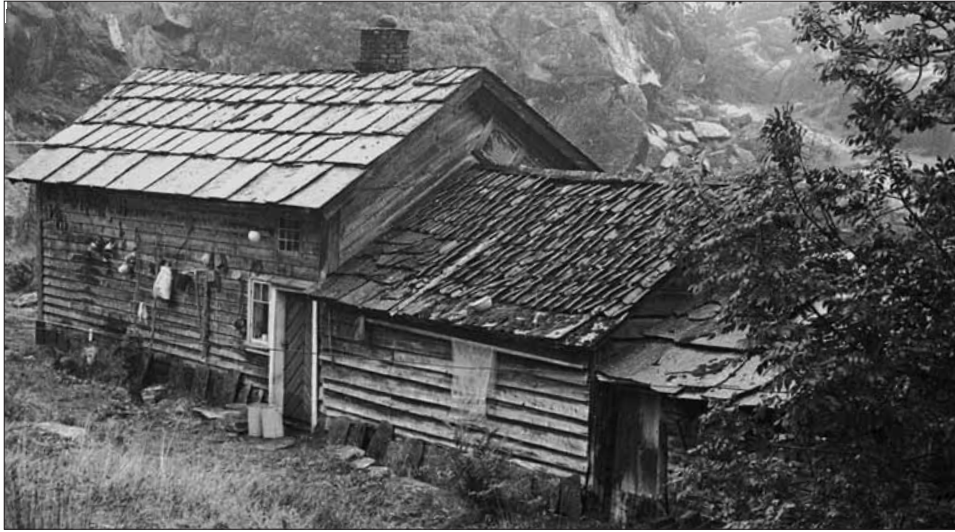
Den eldste delen av stovelåna på Haugsbø skriv seg truleg frå 1700-talet.

Den einbølte, vegause garden HAUGSBØ ligg på austsida av Tittelsneshalvøya, ut mot Ålfjorden. Heilt frå mellomalderen har garden truleg lege under Stord presteembete, fram til 1800-talet. I 1590 er det sagt at han låg øyde, men i 1601 svara Mickel Houghsbø tiend av garden.