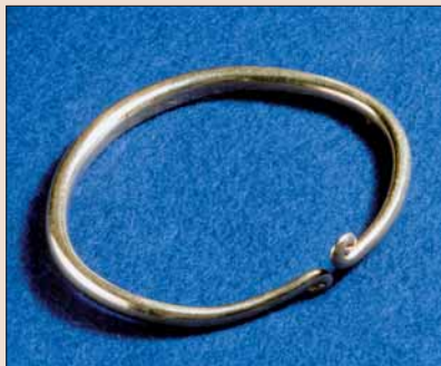
Gullringen frå Vikse.

Ein gullring på nær 75 gram vart funnen ved grøftgraving på VIKSE i Sveio i 1953. Ringen, som er av 22 karat gull og har eit største tverrmål på 8 cm, er laga av ei stong med spiralvridne endar. Han er av ein type som kan daterast til midten av bronsealderen, kring 1000 år f.Kr.