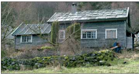
Haugsbø i dag.

Det er den gamle og den nye tid vi møter her. Lemstova, som kan vera bygd tidleg på 1800-talet, har fått ny eldstad med jernonn inne i stova, medan røykstova og eldhuset fører oss rett attende til mellomalderens bustadform. Truleg kan røykstova vera bygd etter brannen i