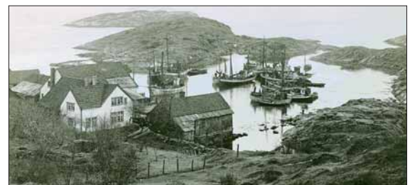
Den gamle handelsstaden på Tjernagelsholmen kring 1920.

No er det slutt på handels- og næringsverksemd på Tjernagelsholmen, men den lune bukta ligg her, til glede for dei fritidsbåtane som finn vegen hit.