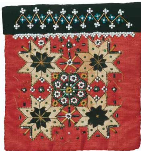
T.v.: Ein bringeklut frå Bu museum.

Hovudbygningen på den gamle skrivargarden, freda i 1924, vart ombygd i sveitserstil ved eigarskiftet i 1880. Det einaste som står att av det opphavlege interiøret er storstova mot nord, «salen», med dører, listverk, fotpanel med marmorerte fyllingar og eit originalt 1700-tals furugolv. Denne bygningen vert no kjernen i eit norsk rettsmuseum, flytta til ei ny tuft tvers over vegen for den tidlegare sorenskrivargarden på Helleland. □