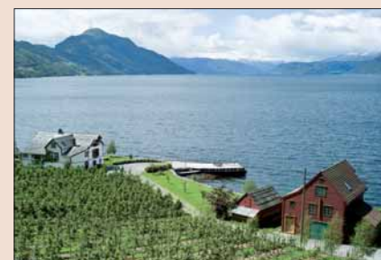
Hardanger Gjestegard, Ytre Alsaker – ny næring under gamle tak.