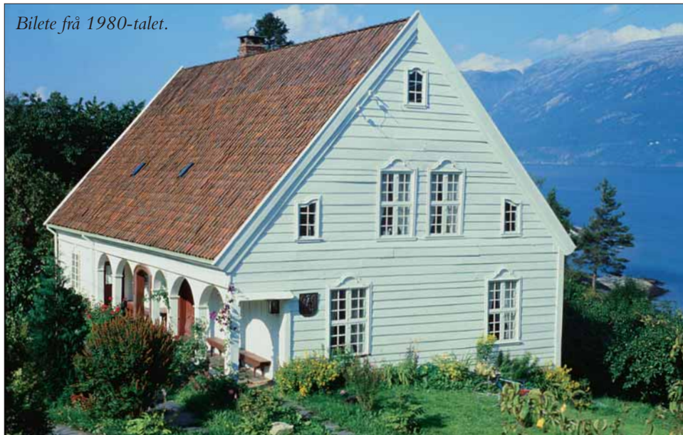
Bilete frå 1980-talet.