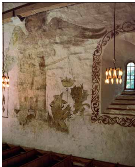
I restane av kalkmåleriet skimtar vi «Sankte Sålemikkjel».

fonten, av kleberstein, er frå mellomalderen. Preikestolen har ei spesiell form. Opphavleg kan han ha stått framfor korbogen som ein såkalla lektoriepreikestol; ein type som er sjeldan i Noreg. Stolen, som er måla av PETRUS REIMERS frå Neustadt i 1609, vart gjeven til kyrkja av lensherre JØRGEN BROCKENHUUS. Under restaureringa i 1961 vart den gamle gallerifronten sett på plass att. □