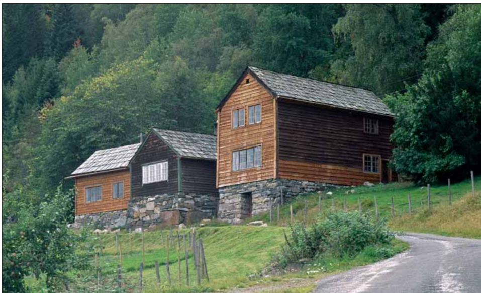
Det eldste tunet på Fryste eller Frøystein. Bilete frå 1992.

Garden FRØYSTEIN ved Ulvikfjorden vert i dagleg tale kalla Fryste. I 1614 vart namnet skrivne Frøstemb – ei tydeleg fordansking – og forma Frøsten vart brukt fram til matrikkelen av 1886 og 1907. Truleg har gardsnamnet opphavleg vore Frystvin; eit vin-namn. Det bar såleis korkje med Frøy eller med stein å gjera.