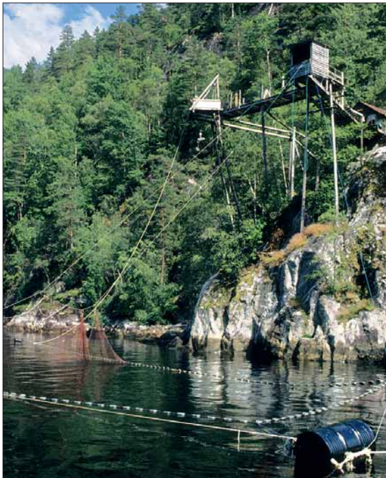
Sitjenøter og laksegiljer er framleis å sjå i kulturlandskapet i dei indre nordhordlandsbygdene. Laksefiske har vore ei viktig attåt-næring i desse bygdene.