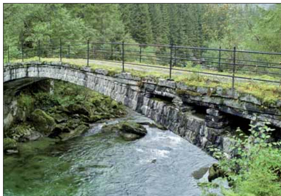
342 Kvelvbrú på Langeland i Teigdalen.