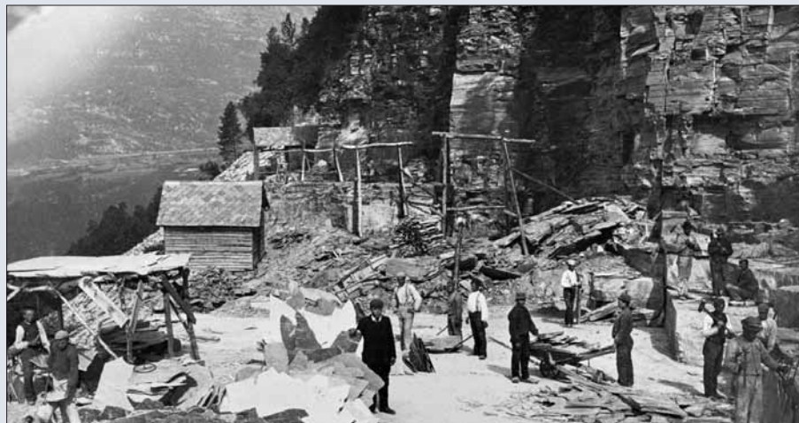
Helledrift på Nordheimsberget. Før 1898.

Enno driv nokre på gamlemåten, på ein liten hellebenk.