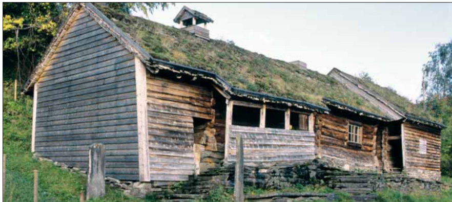
Oppheim gamle prestegard. Bilete frå 1990.

I bakkeballen ovanfor Oppheim kyrkje ligg den gamle prestegarden på OPPHEIM. Ruslar du opp vegen frå kyrkja, kjem du opp i eit tun med spor etter mellomalderens byggjemåte og bustadform.