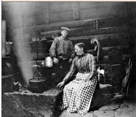
Interior frå røykstove på Gjukastein. Eldre bilete.

Til å hengja kjelen over åren nytta dei ein «galge» som var festa til vegg; ei såkalla sveiv eller gøye. I andre stover hadde dei ein fast stokk over åren, ein randås, til same bruk. På åren hadde dei eld det meste av døgeret, medan røykonn vart fyrst opp kvar kveld og morgon og fungerte som eit varmemagasin.