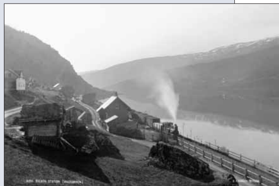
Bulken stasjon i 1880-åra.

meret kunne skjerast til plankar og bord. Før laut det fløyttast ut på elva som rundtømmer. Mjolk kunne seljast til Bergen. Eksismoar og skular vart lagde til Vöss, og Vangen voks fram som handelssentrum. Før hadde mest alle vossingar arbeidt i jordbruket, no kom andre næringar til.