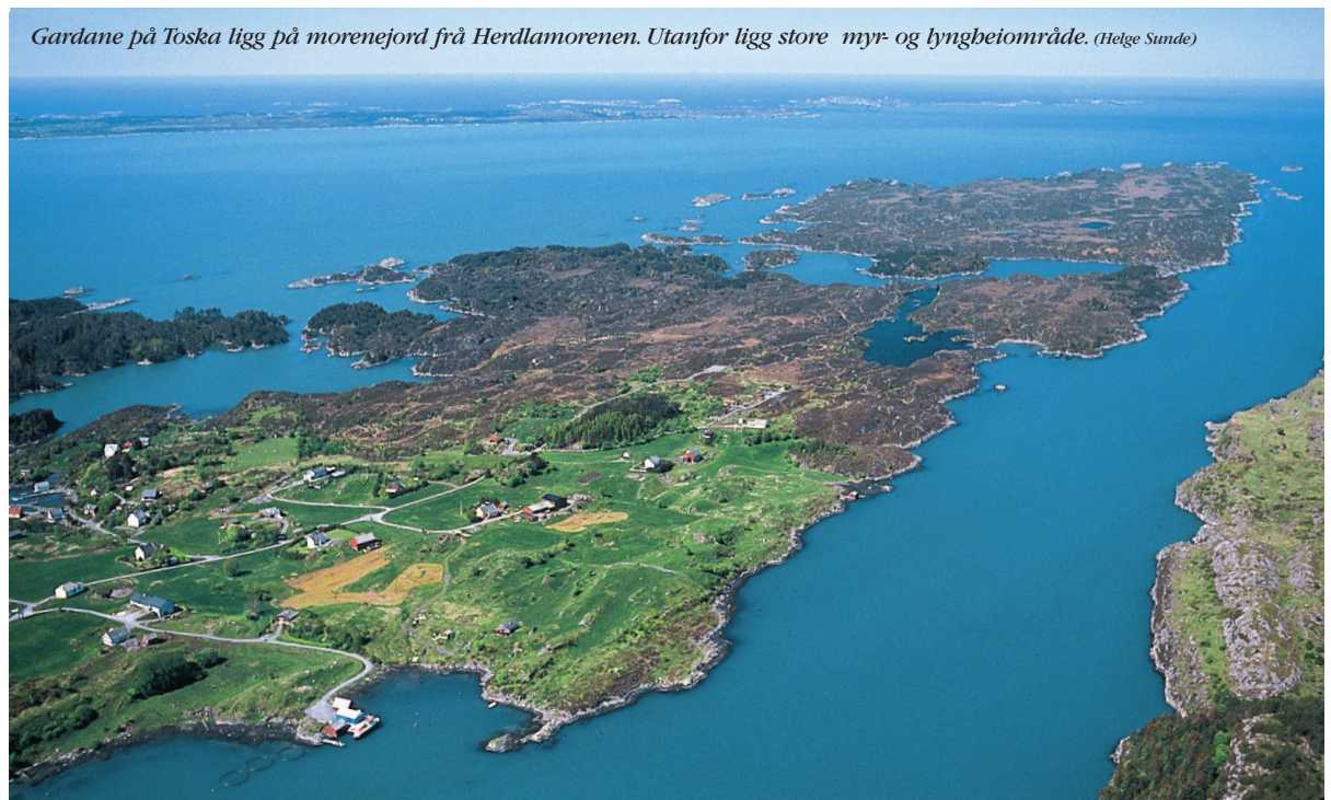
Gardane på Toska ligg på morenejord frå Herdlamoren. Utanfor ligg store myr- og lyngbeiområde.

Sjøområda kring Toska er grunne og rike på småfisk. Det har gitt grunnlag for ein uvanleg god hekkebestand av siland, som