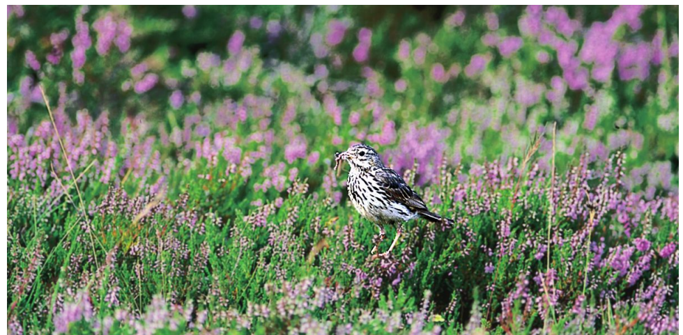
Heipiplerke, lyngbeifuglen framfor nokon. (Ingvær Grastveit)

Biletet viser Noregs finaste titanittkrystall, funnen på Toska. Titanittkrystallen, som er uvanleg stor og klår, er vist på store mineralutstillingar kringom i verda. Namnet kjem av det greske ordet for kile, som viser til krystallforma. Titanitt blir brukt til framstilling av fargepigmentet titanoksid. Prøven er utstilt i Bergen Museum, De naturhistoriske samlinger. Der er det òg utstilt ein meterstor bergkrystall frå Toska.